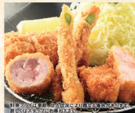
へれとんかつと エビかつの 合い盛り膳