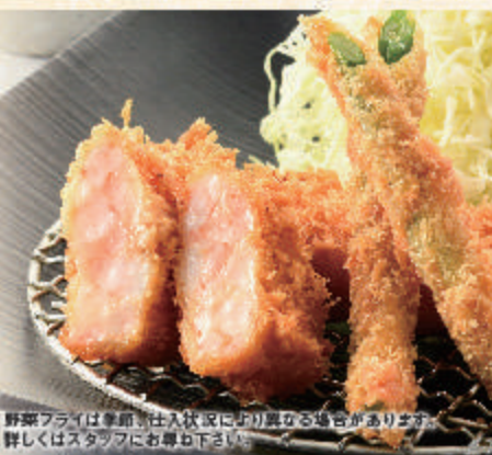
エビかつ膳 旬の野菜フライを添えて