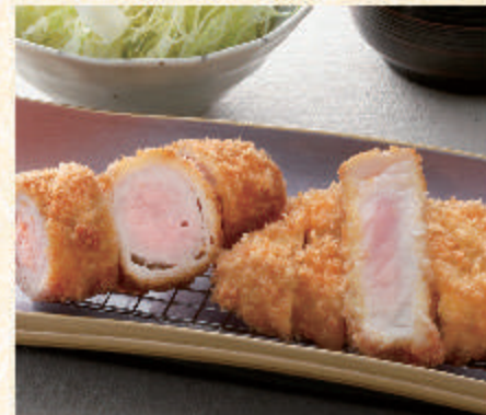
へれとロースの 合い盛り とんかつ膳

料理内容 へれかつ(85g) エビかつ(85g) 季節の野菜フライ キャベツ・小鉢・海苔 お味噌汁・香の物 定番メニューを一度に味わえる一皿。運った時はコレ！