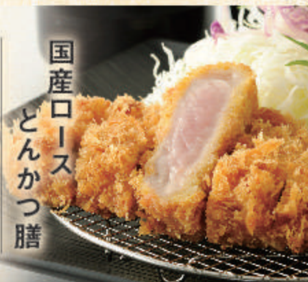
国産ロース とんかつ膳

(140g) 1,480円 (少なめ110g) 1,300円 (厚切り200g) 1,880円