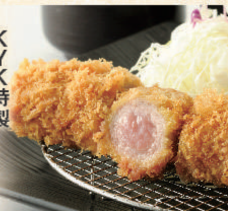
KYK特製 へれとんかつ膳