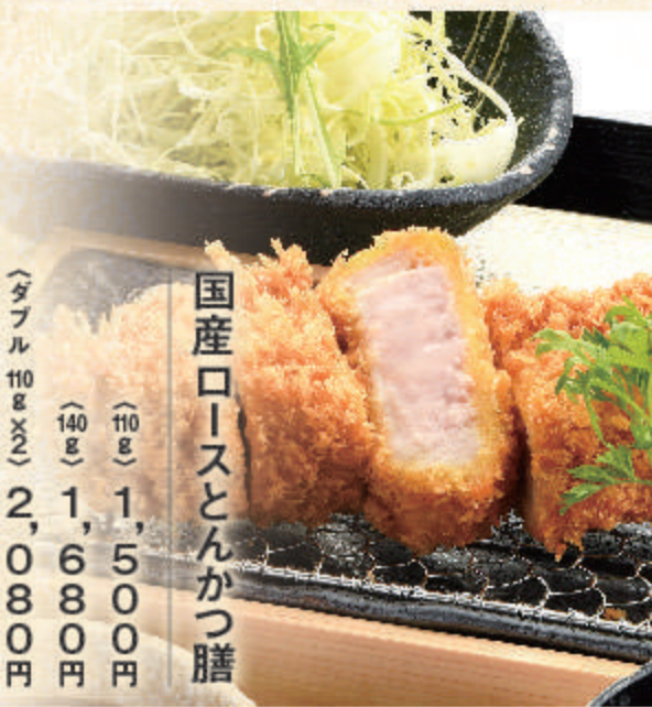
国産ロースとんかつ膳

1,660円 料理内容 ヘレとんかつ(130g)・キャベツ 小鉢・御飯・お味噌汁・香の物