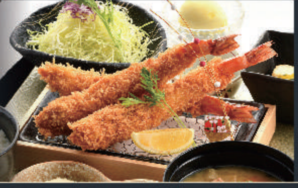
天然大海老 フライ膳

1,900円 料理内容 天然大海老フライ ロースとんかつ キャベツ・小鉢・御飯 お味噌汁・香の物