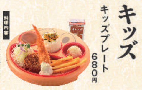
キッズ キッズプレート

2,080円 料理内容 天然大海老フライ キャベツ・小鉢・御飯 お味噌汁・香の物