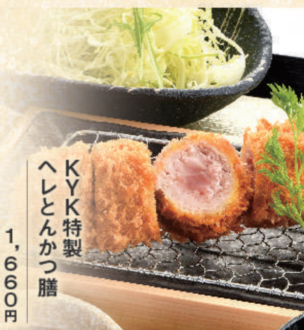
KYK特製 ヘレとんかつ膳

1,660円 料理内容 ヘレとんかつ(130g)・キャベツ 小鉢・御飯・お味噌汁・香の物