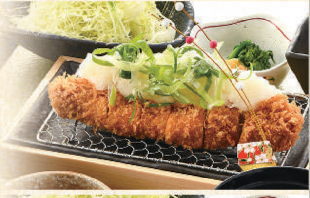
九条葱と 大根おろしの 白雪とんかつ膳

2,000円 料理内容 醤油ヘレとんかつ・海老かつ 国産フライ・キャベツ 小鉢・御飯・小とん汁 香の物・デザート