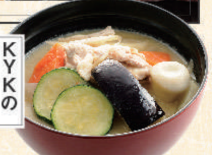
KYKの 食べる とん汁