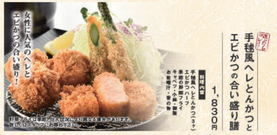
手巻風ヘレとんかつと エビかつの合い盛り膳

1,800円 料理内容 手巻風ヘレとんかつ(3ヶ) ロースとんかつ(20g) キャベツ・小鉢・御飯 お味噌汁・香の物