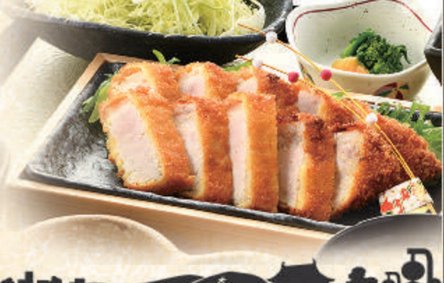
京風味噌漬け ロース とんかつ膳

1,600円 料理内容 京風味噌漬けロースとんかつ キャベツ・小鉢・御飯 お味噌汁・香の物