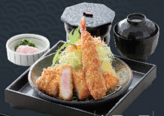
天然大海老 フライと ヘレとんかつ膳

1,950円 料理内容 天然大海老フライ ヘレとんかつ キャベツ・小鉢・御飯 お味噌汁・香の物